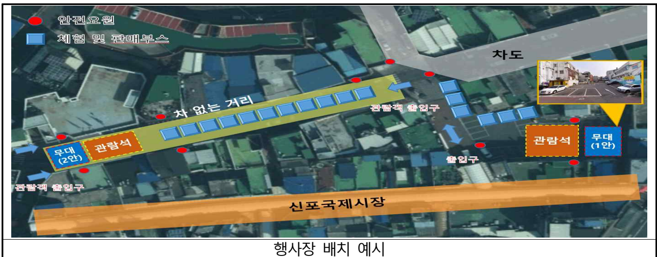
행사장 배치 예시