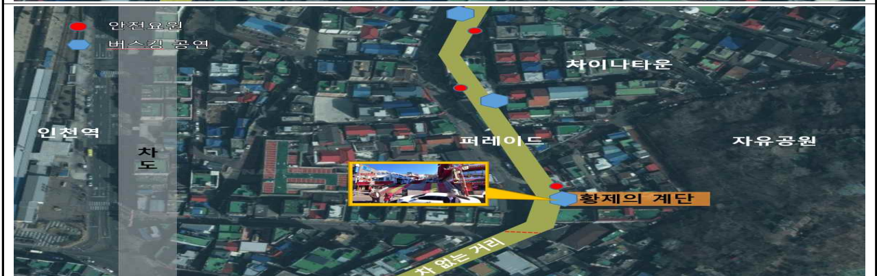
행사장 배치 예시